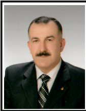
Halis Duran Oda Sicil Yrd. Hizmetler