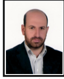
Nihat ELİBOL Meclis Başkan Yardımcısı

Odamız 14 Şubat 2009'da yapılan seçimler sonrasında 31 kişilik Meclisini oluşturmuş ve faaliyetlerine başlamıştır. Mevcut Meclis Üyeleri , aşağıdaki gibidir.